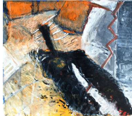
Ich liege dich-zickzack Mischtechnik auf Papier, 1999 27x30 cm