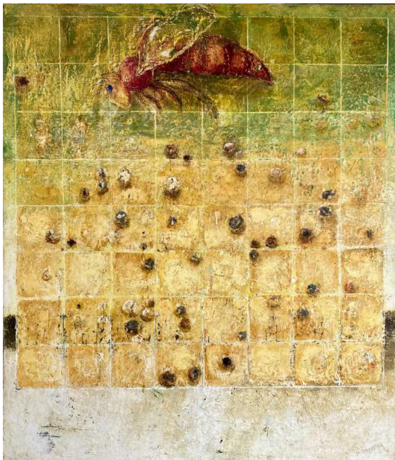
Tod einer Königin