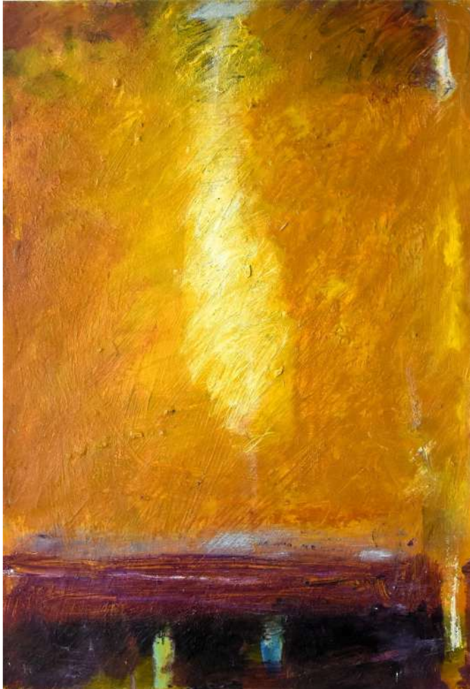
Landschaft mit gelber Krawatte