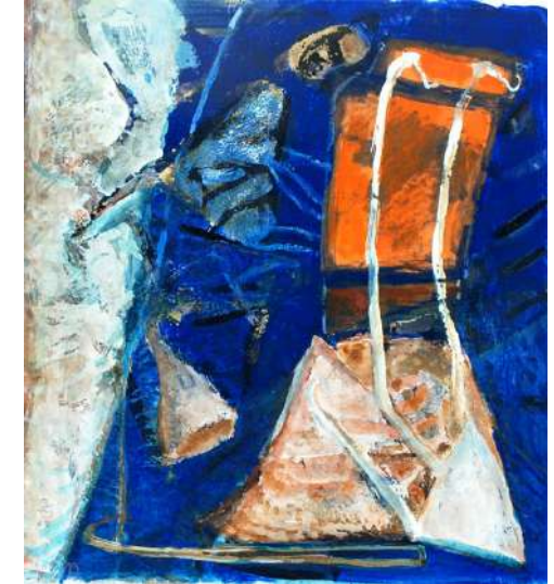
Haken mit Rückseite Mischtechnik auf Papier, 1999 30x27cm