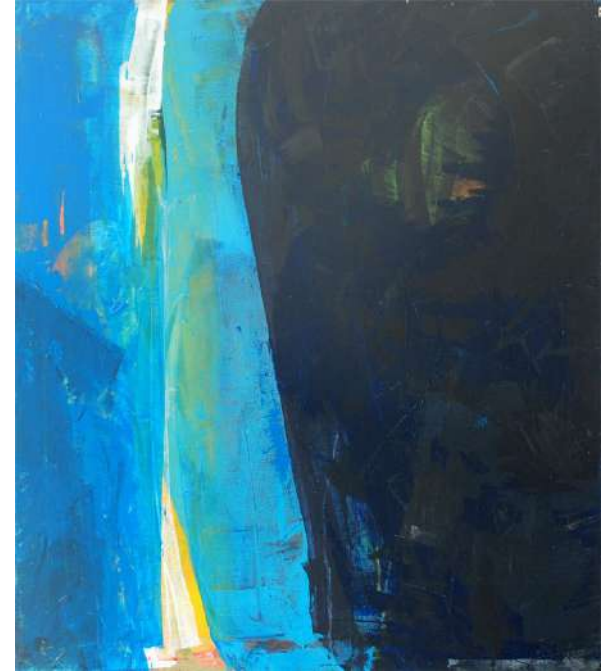
Ohne Titel I - III Acryl auf Molino, 2003 je 70x60 cm