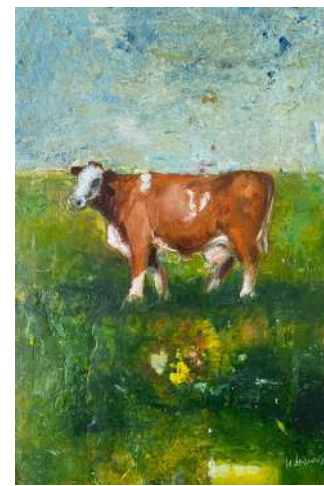
V.I.n.r. Furzl/ Lamperl/ Grasl/ Lady