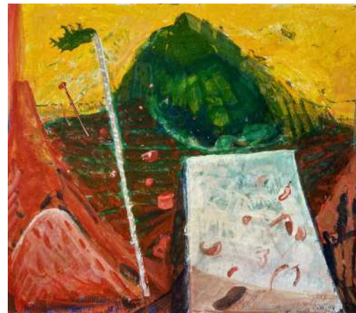
Landeplatz für springende Zukunftsforscher Mischtechnik auf Papier, 1999 28x30 cm