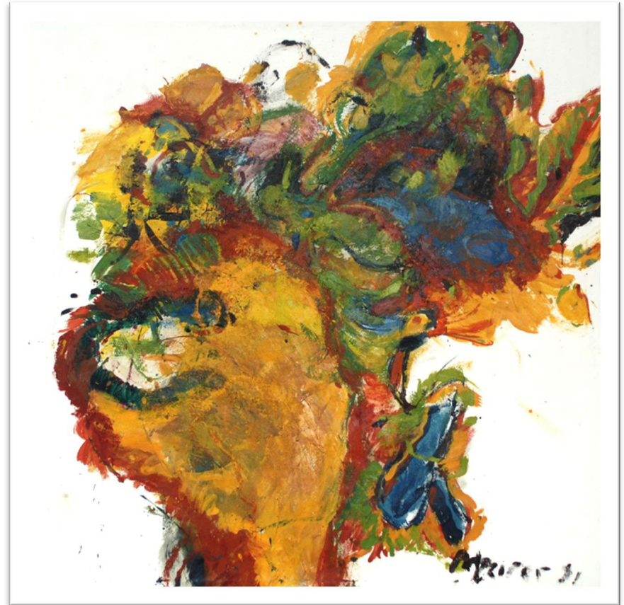
Kopftiger, Enkaustik auf Leinen, 1991, 125x125 cm